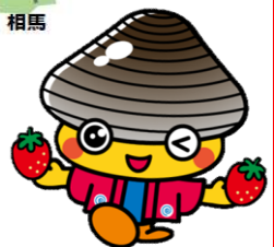
山元町PR担当係長 ホツキーくん