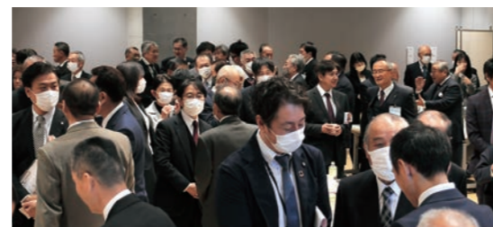
笑顔で懇談する参加者の皆さん