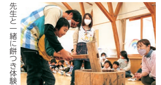
先生と一緒に餅つき体験

子どもたちは「餅をつくとき、みんなが応援してくれてうれしかったです」「お団子の色を考えながら飾り付けました」と話しました。