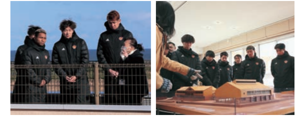
語り部の話を真剣な表情で聴く選手

大地の塔で選手らを歓迎した橋元町長は「語り部による話や震災遺構で、私たちの思いを肌で感じていただけたら幸いです」と話し、「J1昇格を目指して、頑張ってください」とチームにエールを送りました。