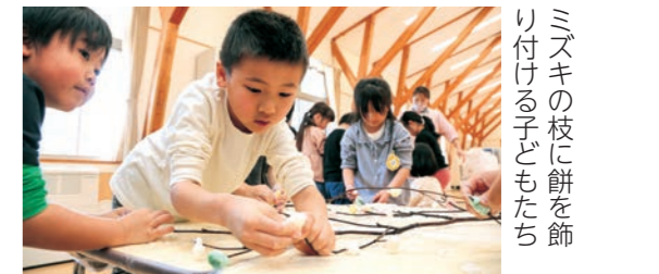
ミズキの枝に餅を飾り付ける子どもたち