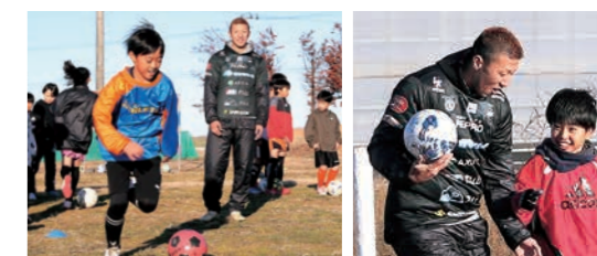
齋藤選手から指導を受ける参加者