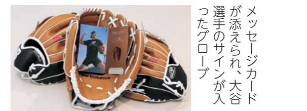
メッセージカードが添えられたグローブが、大谷選手からのサインが入った