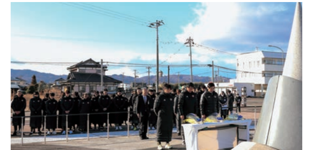
慰霊碑に黙とうをささげる選手とスタッフの皆さん