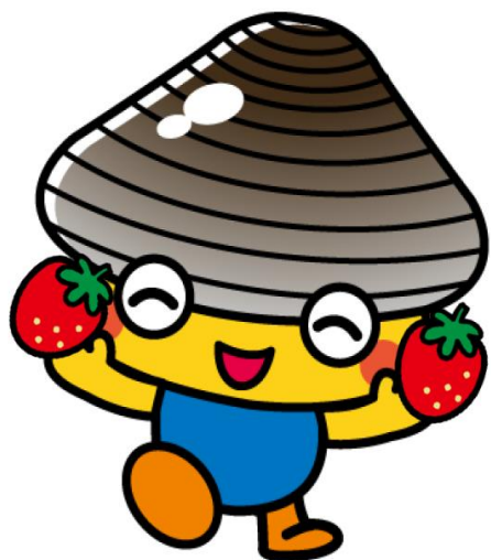
山元町PR担当係長 ホッキーくん