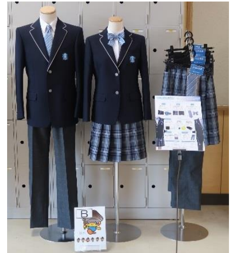
採用デザイン 宮城トンボ株式会社