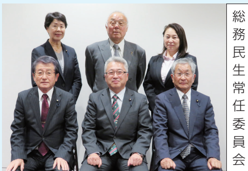
総務民生常任委員会