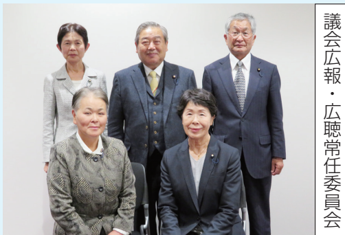
議会広報・広聴常任委員会