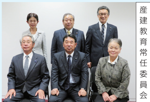
産建教育常任委員会