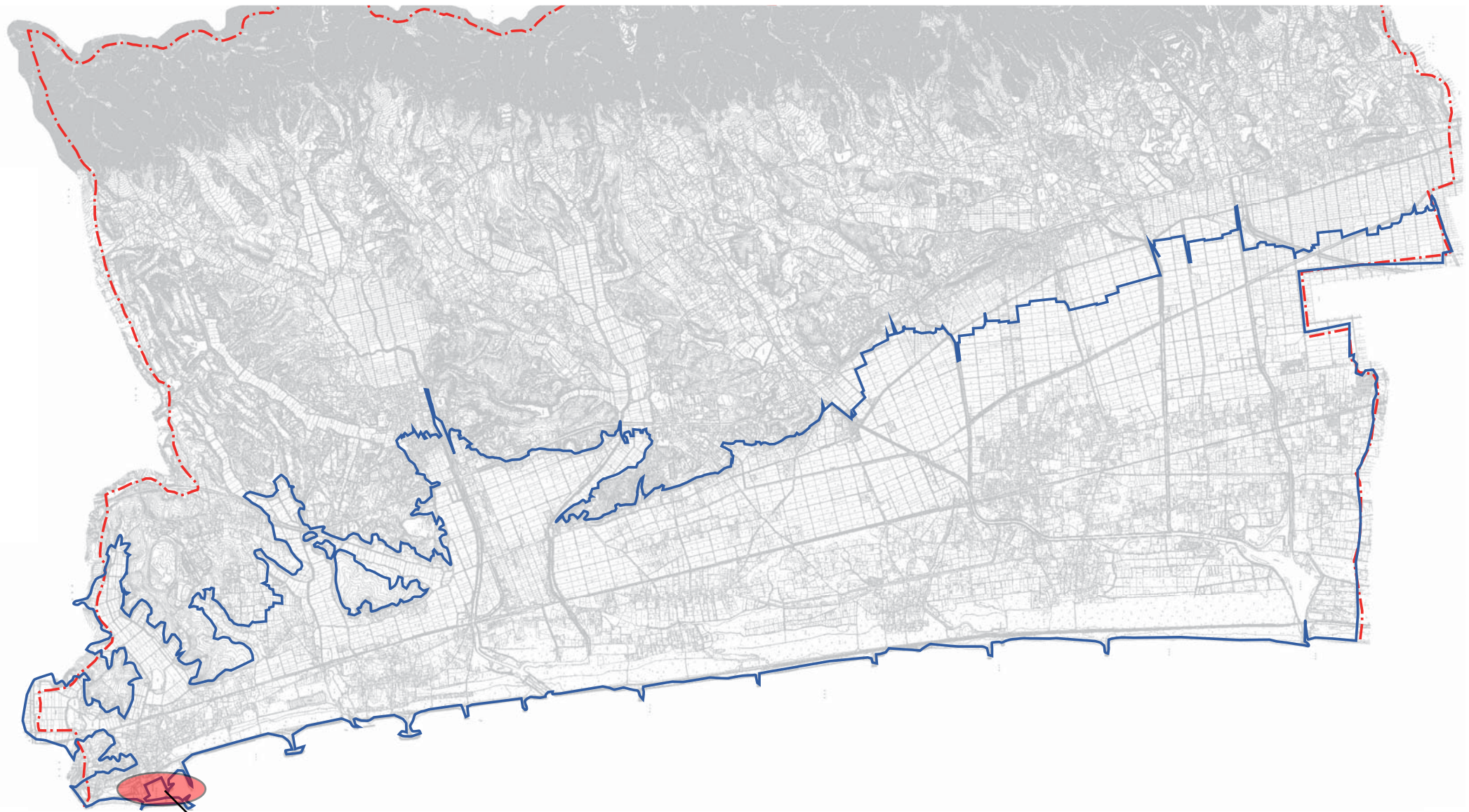
C-6-2漁港施設機能強化事業（静穏度対策整備）