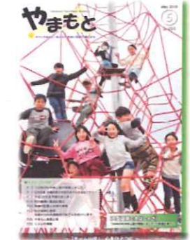
大型遊具で大はしゃぎ！(2016. 5月号)