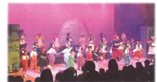
子どもの笑顔元気ミュージカル(2019. 12月号)