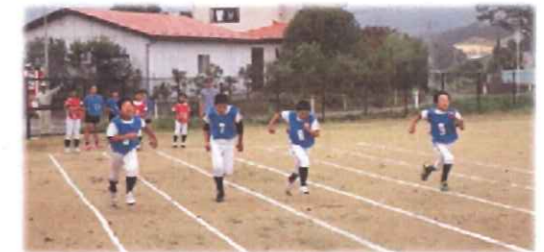
ミニオリンピック大会が開催されました！(2019. 11月号)