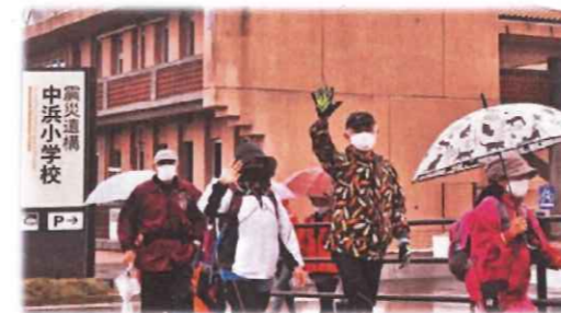
健康づくりウォーキング大会が開催されました！(2020. 11月号)