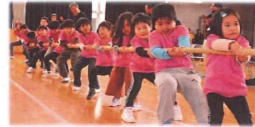
キラリ☆やまもと町民綱引き大会が開催されました！(2019. 12月号)