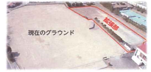
町民グラウンドの拡張・改修工事がはじまります(2020. 7月号)