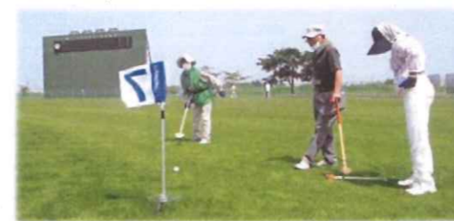
老人クラブ連合会によるグラウンドゴルフ交流会(2020. 9月号)