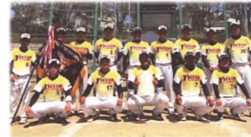
ソフトボールチームの全国大会出場が決定！(2019. 6月号)