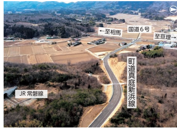
▲全線で開通した町道真庭新浜線(令和4年3月撮影)

町内で整備する避難路のうち、唯一の新設改良工道路線として整備を進めてきた町道真庭新浜線(仮称 新浜諏訪原線)の国道交差点接続工事が完了し、3月30日に全線で供用を開始しました。 本路線は、平成26年度に事業採択を受け、埋蔵文化財の調査や道路整備工事を進め、計画策定から約8年の年月を費やし、今回の完成に至りました。 本路線の供用により、災害時の避難路としての役割のほか、沿岸地域から国道6号へのアクセス性が向上され、安全で利便性の高い道路ネットワーク形成に寄与することが期待されます。