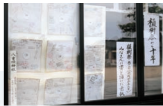
10年前に全国各地のボランティアの皆さんの手で植えられた木々

八重垣神社では、先月10日、平成24年に行われた植樹祭の時に、参加者の皆さんに書いていただいた色紙を納めたタイムカプセルを開封し、その色紙を社務所窓口に展示しています。