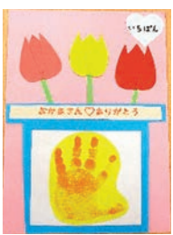
▲手形スタンプをペタッ!

かわいい手形のカードをお母さんにプレゼントしましょう。 時 5/2(月)・5/6(金) 10:00～11:30 場 こどもセンター 対 町内未就園児 ※汚れてもいい服装でお越しください。