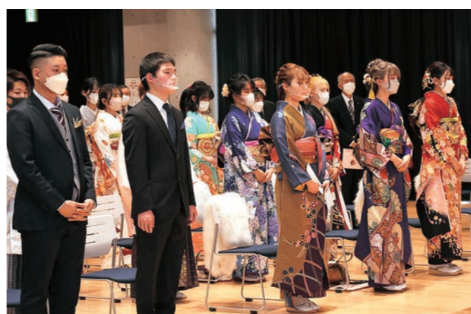
▲令和3年成人式の様子

町では、令和4年度以降の成人式について、18歳の多くが高校3年生であり、進路の選択に関わる時期にあたることから、参加者およびその家庭への負担を配慮し、対象年齢をこれまでどおりの20歳とします。式典は、1月第2日曜日に、名称を「山元町二十歳を祝う会」として開催します。