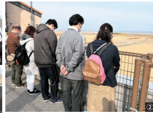
震災遺構中浜小学校屋上から、鎮魂を祈る来館者の皆さん（写真②）