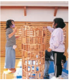
▲友だちと一緒にタワーを作製

時 4/25(月)～4/30(土) 15:00～16:15 ※4/29(金・祝)は除く 場 こどもセンター 対 町内小学生