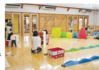
▶大型玩具や手作り玩具でいっぱい遊ぼう!

時 4/22(金) 10:00～11:30 場 こどもセンター 対 町内未就園児