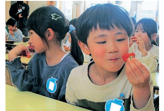
▲真っ赤に熟したいちごで大満足のつばめの杜保育所の子どもたち

真っ赤に熟したいちごを口にした子どもたちからは「甘くておいしい」「とてもジューシー」などの声が聞かれました。