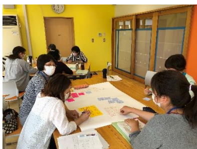
6/1 (水)「事業を円滑に進めるために」