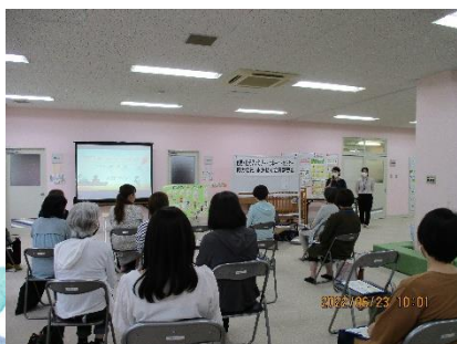
6/23「子どもの栄養と食生活」