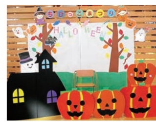
▲フотスポットもあります

ちびっぴまつり いろいろなコーナーでお祭りごっこを楽しみましょう。 時 10/21(金) 10:00～11:30 場 こどもセンター 対 町内未就園児 申 不要 問 こどもセンター ☎36-7251