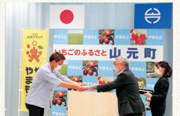
▲事業者に認証書を交付する橋元町長