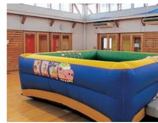
▲ピョンピョン跳ねて楽しいよ

親子であそぼう ～トランポリン～ 時 11/10(木) 10:00～11:30 場 こどもセンター 対 町内未就園児 申 不要 問 こどもセンター ☎36-7251