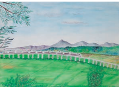
▲絵画などさまざまな作品の展示を予定しています