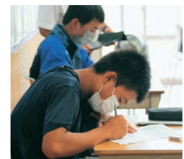
▼メモを取りながら真剣に話を聴く生徒