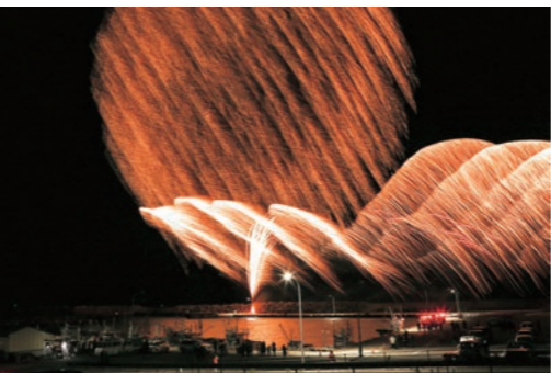
▲昨年(2021年)の磯浜漁港での花火