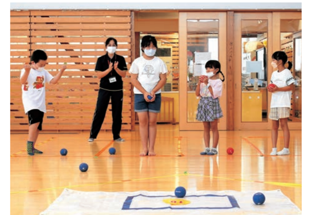
▲ポッチャ体験を楽しむ参加者

参加者は「ジュニア・リーダーに教えてもらった皿回しが面白かったです」「もっと遊びたかったです」と話しました。