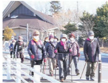
▲山元ノルディックウォーカーズの皆さん

対象者 20歳以上の町内在住者、または町内在勤者 参加費 無料 定員 100人 事業期間 10月～令和5年3月 申し込み 保健福祉課備え付けの申込書に必要事項を記入の上、お申し込みください。(電話可) ※事業期間途中での申し込みも可能です。 ※平成28年度以降ウォーキングポイント事業に参加している方には、個別に継続参加のご案内をしますので、申し込みは不要です。