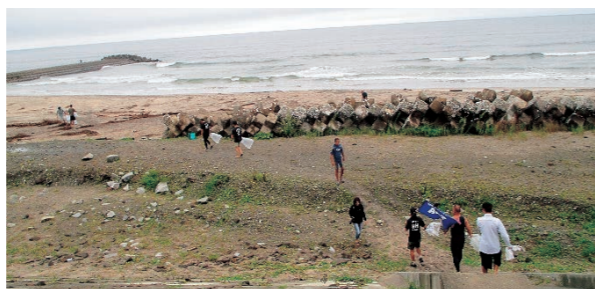
▲定期的に清掃活動を行うサーファーの皆さん