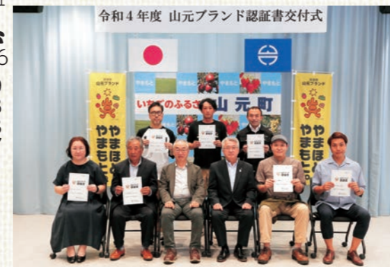
▲令和4年度山元ブランド認証事業者の皆さん

山元ブランド「やまほど、やまもと。」に新たに12品目を認証。全54品目が町をPR