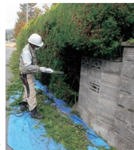
▲剪定作業する会員

シルバー人材センター入会説明会 日時 10月11日(火) 10時～11時 場所 シルバー人材センター 会議室 入会条件 ・本町に居住する原則60歳以上の健康で働く意欲がある方 ・シルバー人材センターの趣旨を理解し賛同する方 主な就業内容 屋内清掃、屋外清掃、植木剪定、手取り除草、草刈り、農作業補助など 問 (一社)山元町シルバー人材センター ☎36-9211