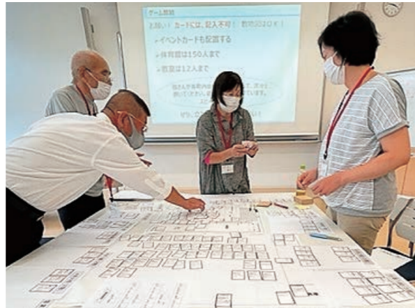
▲積極的に話し合いながら演習に取り組む参加者

講習会では、地震・津波および風水害などに関する基礎知識・防災対策、自主防災組織の役割と活性化の方法について講義が行われ、参加者は真剣な表情で聴講していました。その後行われた演習では、2つの想定に対し、リアリティある意見を積極的に交わし、防災に対する理解を深めていました。