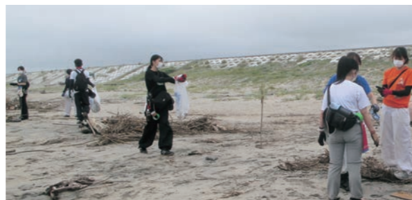
▲花釜から笠野海岸付近を清掃する学生の皆さん

各団体が集めたごみは合計で約200袋を超え、その多くがペットボトルやプラスチックごみでした。参加者は「海洋プラスチックごみは世界的な環境問題であり、ごみを拾ってきれいな状態にするのは大切なこと。これからも清掃活動を続けていきたいです」と話しました。