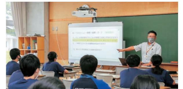
▲生徒からの質問に丁寧に答える講師の(株)マックス設計成田代表取締役

講話を終えて、生徒からは「大変な中でもやりがいを見つけ働くことはカッコいいと思いました。自分の道を真っすぐに進んでいきたいです」などの感想がありました。