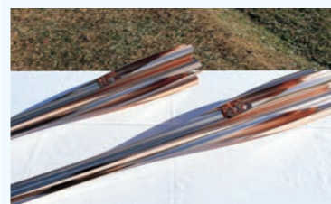
▲東京2020オリンピック・パラリンピックの聖火リレートーチ

山元町スポーツ推進条例を制定 先月16日、町民一人一人の心身の健全な発達と活力ある地域社会を実現することを目的とした「山元町スポーツ推進条例」が施行されました。これは、復興の後押しとして位置付けられた「東京2020オリンピックピック・パラリンピック」が開催され、「聖火リレー」が本町を駆け抜けたことを未来へ継承するとともに、その開催を契機に新たに条例を制定したものです。 町では、今後、関係団体などと連携して、町民のスポーツ活動や健康づくり、スポーツを通じた地域の活性化などに取り組んでいきます。