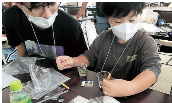
▲実験で酸性、アルカリ性を調べる参加者