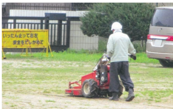
▲校庭の除草作業をする(有)ヒラタ工務店

丁寧な作業により校庭はとてもきれいになり、児童も元気に活動ができるようになりました。