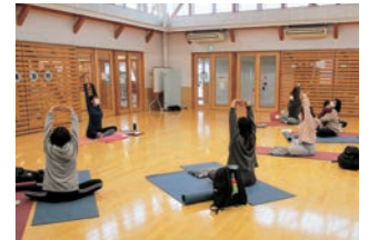
▲ヨガでリラックス