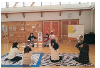
▲楽しい時間を過ごしましょう

【掲載情報の見方】 時 日時 場 場所 講 講師 対 対象 定 定員 持 持ち物 料 料金 申 申し込み 問 問い合わせ