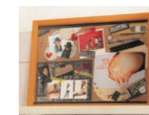
▲シールやスタンプで楽しくフレーム作り