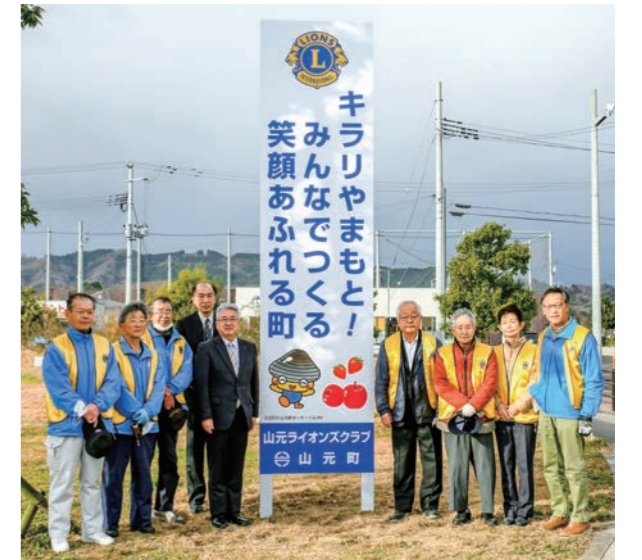
▶看板の前で記念撮影する関係者一同

同会では、記念事業として山元中学校吹奏楽部への楽器用品導入支援と、NPO法人夢ふうせんおよび（一社）さんらいずに対するパソコン購入支援も行っています。