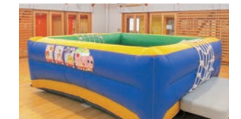
▲上手にピョンピョンできるかな?