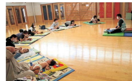
▲優しくマッサージ