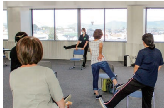
▲気軽にできるメニューを紹介します