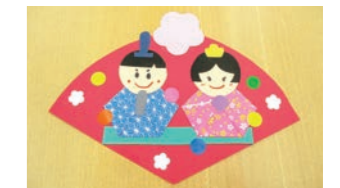
▲かわいいおひなさまを作ろう