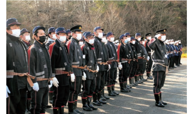
▲法被姿で毅然と整列する消防団員