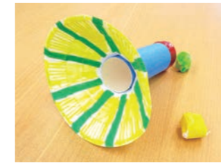
▲紙皿を使って作ってみよう