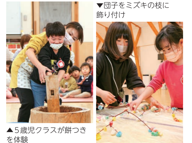
▲5歳児クラスが餅つきを体験

団子さしは、豊作と健康を祈る小正月の行事です。子どもたちは「みんなが幸せになるようにと願いを込めて団子をさしました」「色を考えながら飾り付けたのが楽しかったです」と話していました。