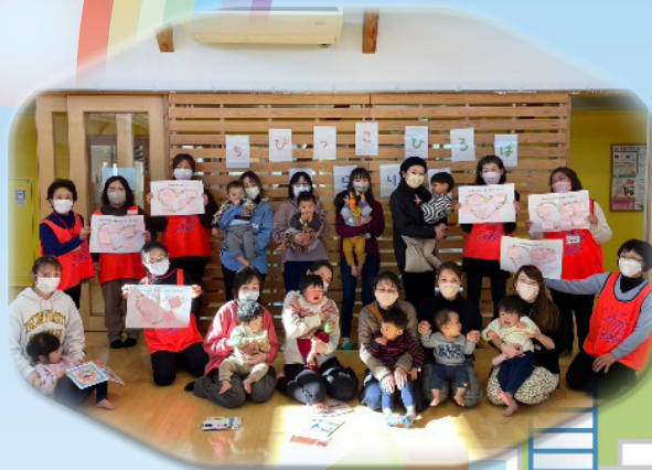
ちびっこひろば「きらり☆」