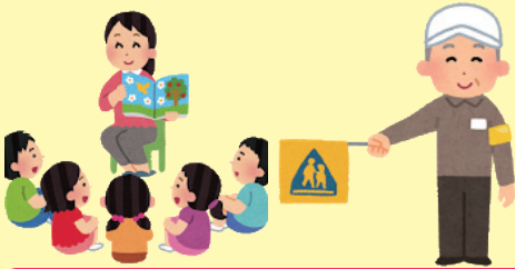
子供の学びを核とした「協働教育」