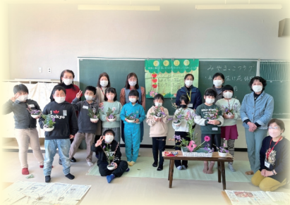
地域の方による生け花教室

○「はまっこキッズ」 会場:坂元小学校 (毎週金曜日午後2時30分～4時00分)