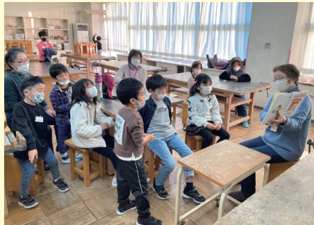
放課後子ども教室(はまっこ)