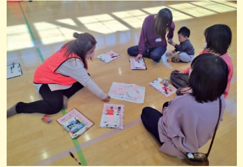
家庭教育支援チーム「つばめ」