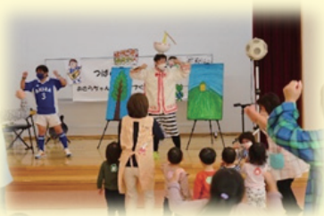
ちびっこひろば「きらり☆」

町内の子育てや家庭教育に関する支援を行うことで、安心して子どもを育てる町づくりを推進しています。子どもとの触れ合いが好きな方、子育てのお手伝いをしたいという方など、気軽にお問い合わせください。