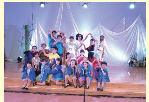
ミュージカル「SENKOKUタイムスリップ」