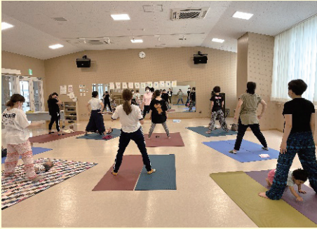
ちびっこひろば「きらり☆」

未就学児とその保護者を対象とした家庭教育講座『ちびっこひろば「きらり☆」』、次年度就学予定の幼児とその保護者を対象とした『家庭教育学級・幼児学級』などの家庭教育支援事業を、山元町家庭教育支援チーム「つばめ」と連携しながら進めています。