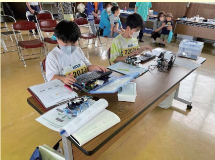
ロボットプログラミング大会