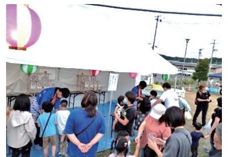
『さかもと夏まつり派遣』