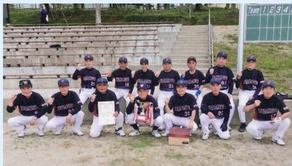
昨年、全日本ハイシニアソフトボール大会宮城県大会で優勝した山元クラブの皆さん

WBCなどのスポーツ中継で体を動かしたくなった方、ぜひ一緒にさわやかな汗を流しませんか。