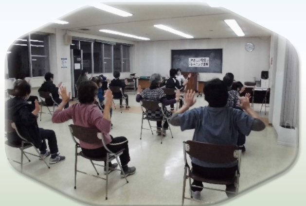
令和4年度公民館事業 「やさしい貯筋トレーニング」