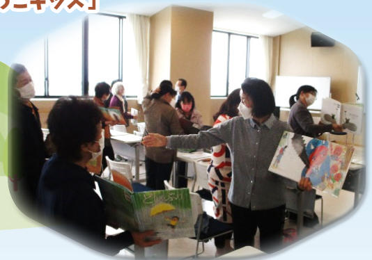
令和4年度公民館事業 「絵本の読み聞かせ」