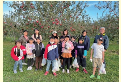
放課後子ども教室(みやまっこ)