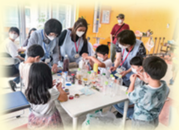
自主事業「つくってあそぼう」