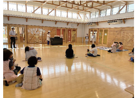
昨年度のちびっこひろば「きらり☆」の様子