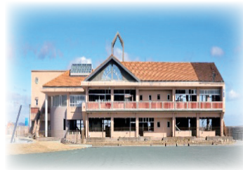
震災遺構中浜小学校