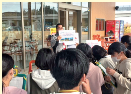
地域を題材とした学習