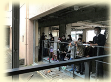
震災遺構中浜小学校の見学