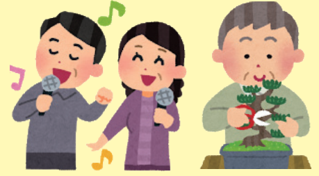
団体やサークルでの活動