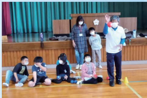
昨年度の出前教室の様子

ニュースポーツは子どもから高齢者まで、運動量を参加者自身が調節できるものが多く、自分の体力と相談しながら楽しめます。運動が苦手な人や、普段あまり運動をする機会が少ない人にもおすすめです。