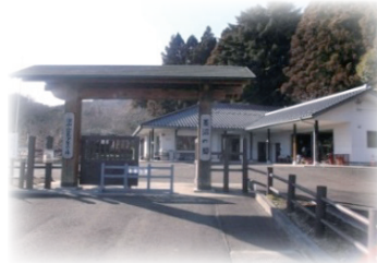
深山山麓少年の森