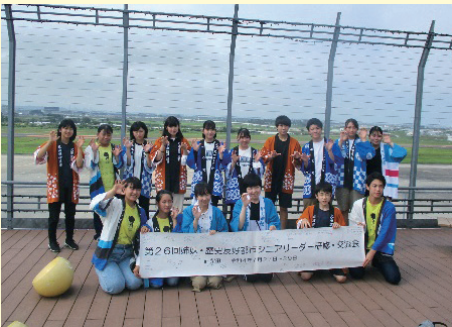
ジュニア・リーダー活動

地域の方々にご協力いただいたり、地域に存在している教育資源(もの、こと)を活用したりしながら、子どもたちが健やかに成長していくための事業を進めています。