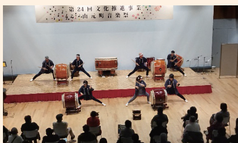
文化推進事業「山元町音楽祭」の様子