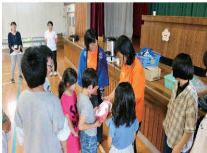
『ちびっこ盆おどり』