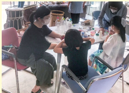
つくってあそぼう