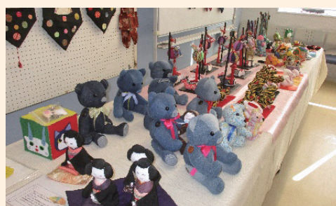
町民文化祭での作品展示