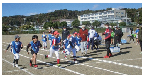
ミニオリンピックの様子