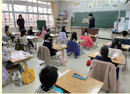
家庭教育学級・幼児学級