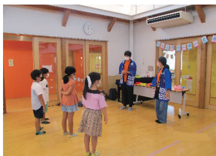
『子どもセンターで遊ぼう』