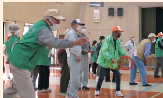
輪投げのつどいの様子