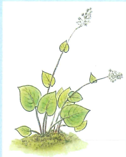
アブクマトラノオ (たで科)

イワガネソウ・ヒメヤブラシ・ギンリョウソウ チヂミザサ・ヤマジノホトトギス フデリンドウ・チゴユリ・カタクリ オオバジャノヒゲ・ヤブレガサ・タカトウダイ イチャクソウ・リンドウ・ツルリンドウ アキノキリンソウ・ニンソウ ショウジョウバカマ・ナガバノコウヤボウキ サワアザミ・キンラン・ギンラン・シュンラン ネコノメソウ・ツリフネソウ・トリカブト ニッコウキスゲ・ウラシマソウ・エンレイソウ フユノハナワラビ・アブクマトラノオ など