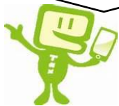
e-Tax キャラクター イータ君

「e-Tax」で申告書を作成・印刷し、 郵送または町を経由して提出（紙の申告書に記入して提出も可能です）