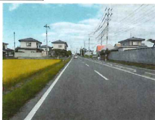
完成②（起点部～中間部を望む）