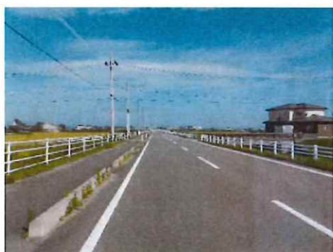
完成③（中間部～終点部を望む）