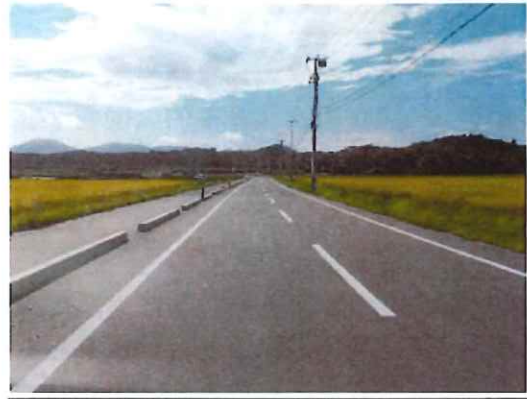
完成④（県道交差部～水神沼周辺を望む）