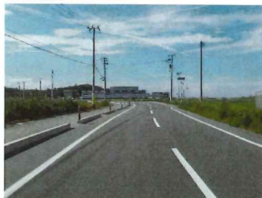
完成②（終点部～県道交差部方向を望む）