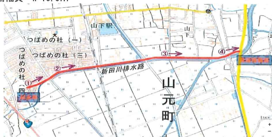
施工位置図（撮影位置付記）