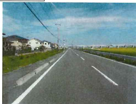
完成②（起点部～中間部を望む）