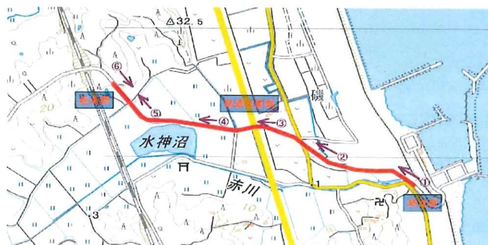
施工位置図（撮影位置付記）