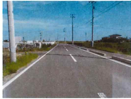
完成④（中間部～終点部を望む）