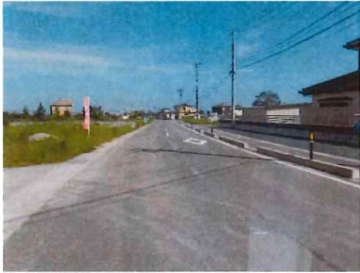
完成③（中間部～終点部を望む）