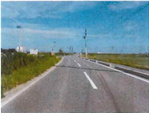
完成⑤（終点部周辺～終点部を望む）