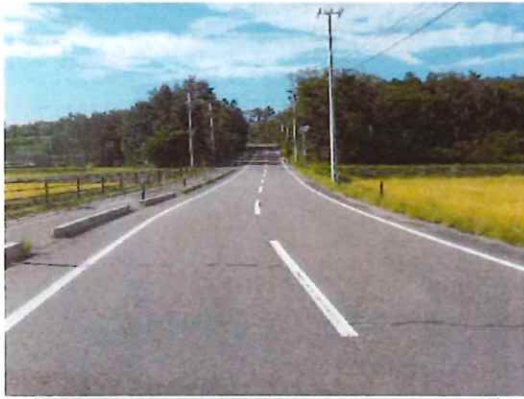
完成⑤（水神沼周辺～起点部を望む）