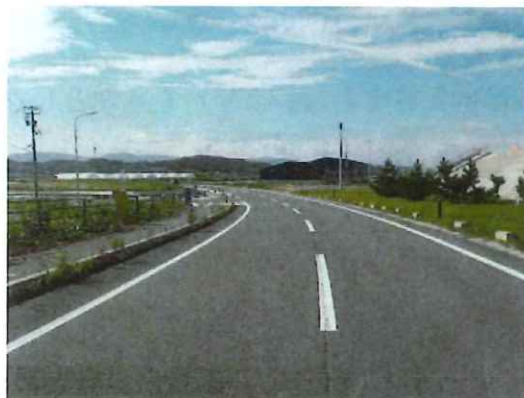
完成①（終点部）※磯浜漁港周辺