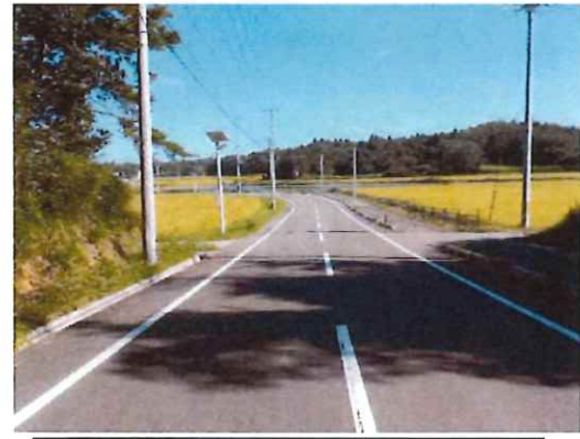
完成⑥（起点部～終点部方向を望む）