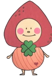
山元町こどもセンターのキャラクター『いちぽん』です！

未就学児のお子さんと保護者の方専用のお部屋です。ランチは、ミニキッチンのあるお部屋で食べることができます。