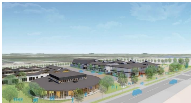
公園(西側)と小学校(東側)との一体感、安全な相互アクセス

こどもセンターは、北には「つばめの杜保育所」、西には「つばめの杜中央公園」、東には「山下第二小学校」があり、周辺一帯が「子育て支援エリア」として、町の子育て支援の中核を担っています。