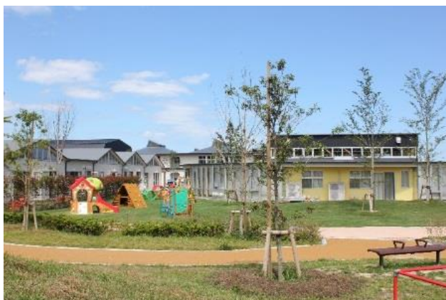
つばめの杜中央公園とつながっており、自由に行き来ができる”親子ひろば”