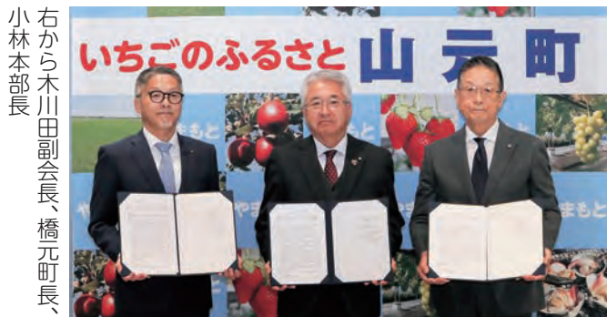
右から木川田副会長、橋元町長、小林本部長