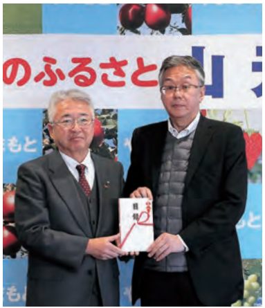
大坪代表取締役(右)と橋元町長(左)

引き続き、スポーツ少年団の活動の充実を図り、子どもたちの成長に寄与できるよう、寄付金を活用した各種事業に取り組んでいきます。