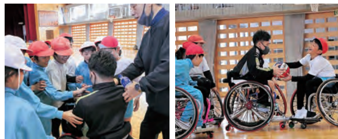
選手と触れ合う児童

ミニゲームでは、児童が伊藤選手の力強いプレーに果敢に挑戦。実際に車いすを操作した児童は「曲がるのが難しかった」「伊藤選手のスピードがすごかった」と驚きを語りました。