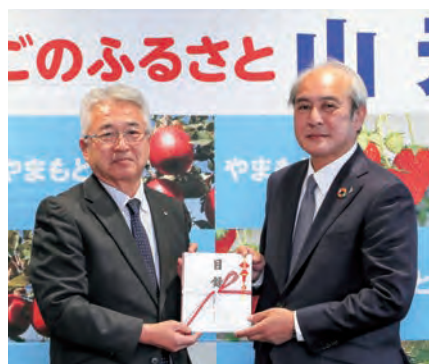
対馬将夫取締役本部長(右)と橋元町長(左)