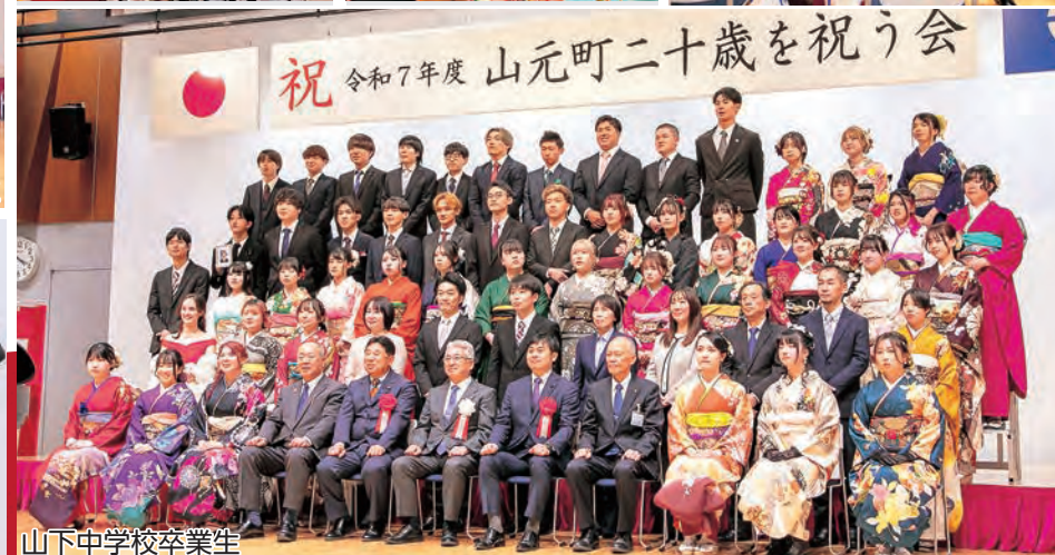
山下中学校卒業生