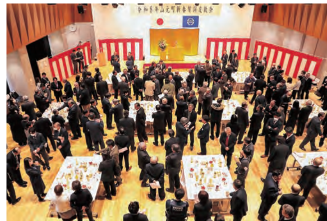
交流を深める参加者の皆さん