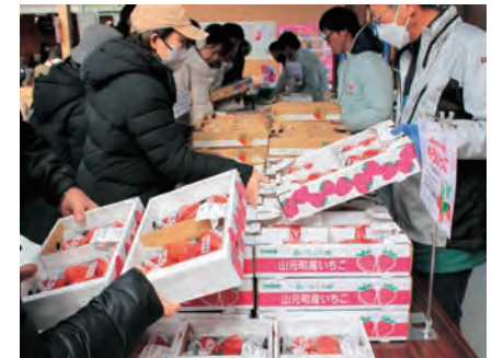
いちご販売の特設会場 (写真は昨年の6周年記念感謝祭)