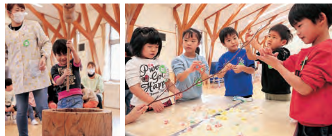
力強く餅つき体験 ミズキの枝に餅を飾り付ける子どもたち

つき上がったお餅は色鮮やかに染めてミズキの枝に丸めて飾り付けました。仕上げに縁起物の飾りを付けると、彩り豊かな正月飾りが完成しました。