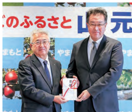
菊地盛夫代表取締役社長(右)と橋元町長(左)