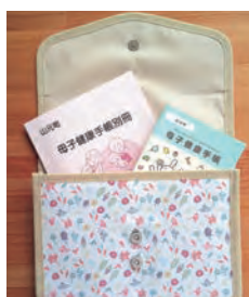
寄贈された便利なケース