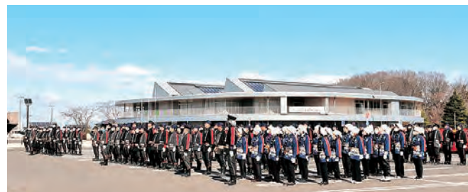
消防団員と女性防火クラブ連合会員の皆さん

式典では、機械器具点検や分列行進も行われ、各団員は号令に従い規律のある行動を披露し、地域の安全を守る決意を新たにしました。