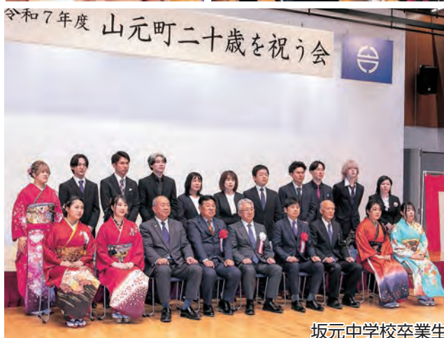
坂元中学校卒業生

幼い頃からの夢である新幹線の運転士を目指し、現在は大学で経済学を学んでいます。常に「人のために」という想いと責任感を持ち、信頼される運転士になりたいです。