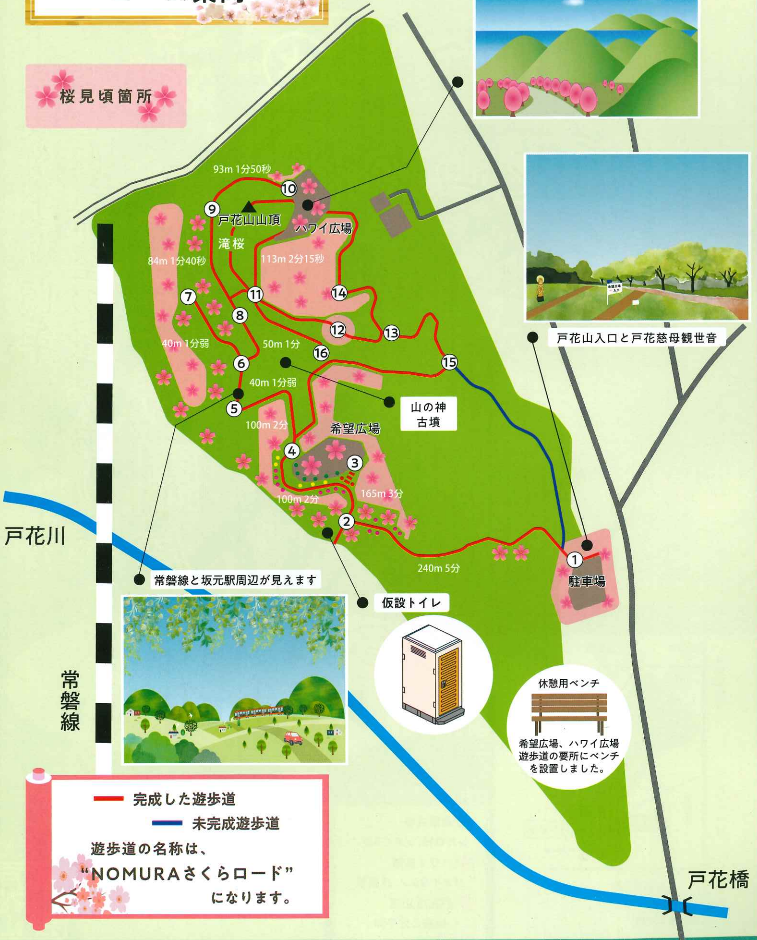
常磐線と坂元駅周辺が見えます