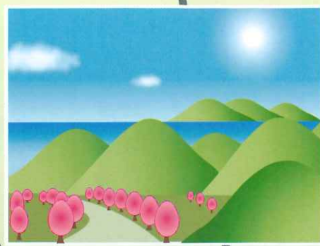
ハワイ広場から太平洋が一望出来ます