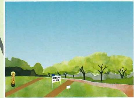
戸花山入口と戸花慈母観世音