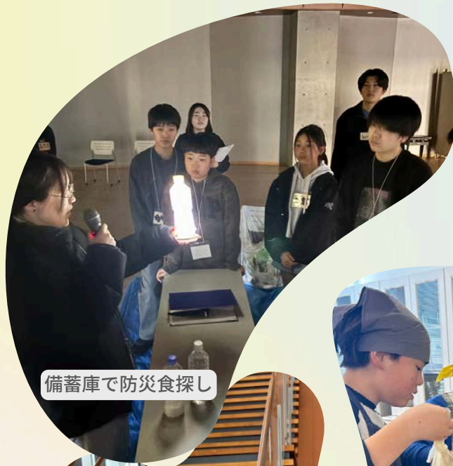
備蓄庫で防災食探し