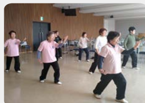
太極拳愛好会 (ふるさとおもだか館)