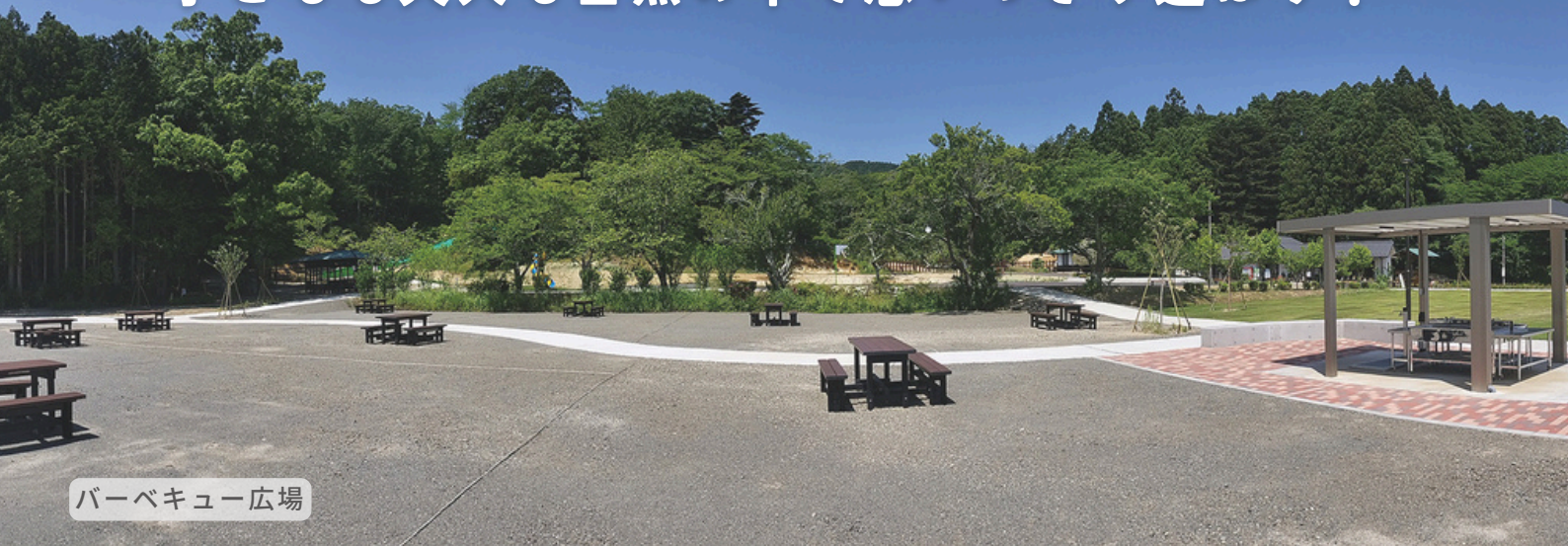
バーベキュー広場