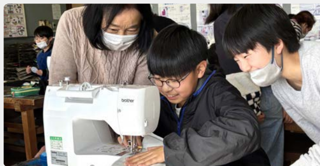
山下小学校 ミシンボランティア