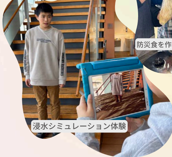
浸水シミュレーション体験