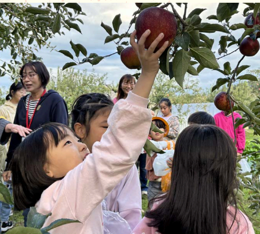
放課後子ども教室「みやまっこクラブ」りんご狩り体験