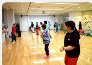
ひだまりサークル (ふるさとおもだか館)