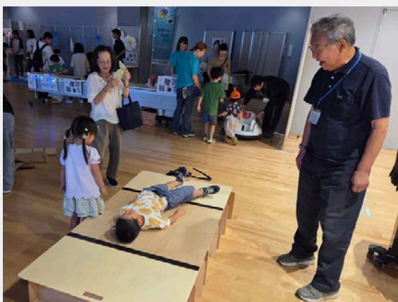
防災ワークショップ 簡易ベッド組み立て体験

誰もが生涯にわたり活躍できるよう、生きがいをもって学ぶことのできる環境づくりや文化芸術にふれあう機会の創出、スポーツやレクリエーションに親しめる環境づくりに取り組んでいます。