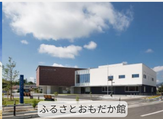
ふるさとおもだか館