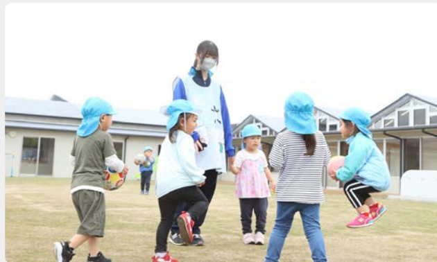
山元中学校職業体験 つばめの杜保育所