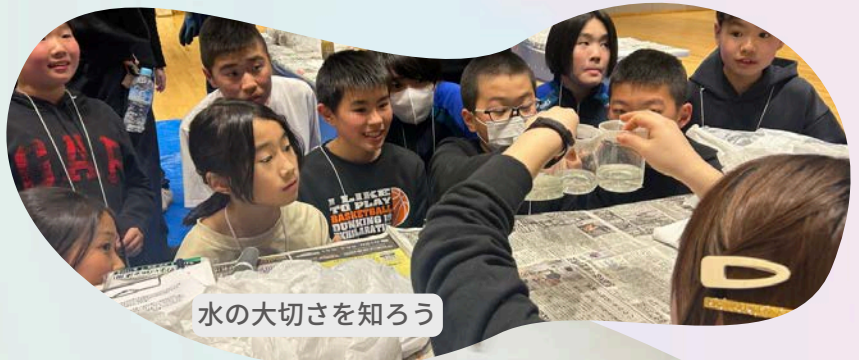
水の大切さを知ろう