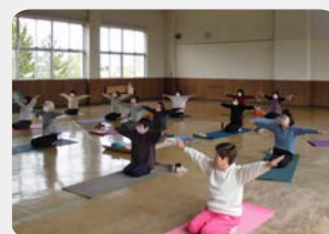
ピラティス愛好会 (中央公民館)