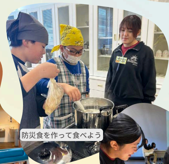
防災食を作って食べよう