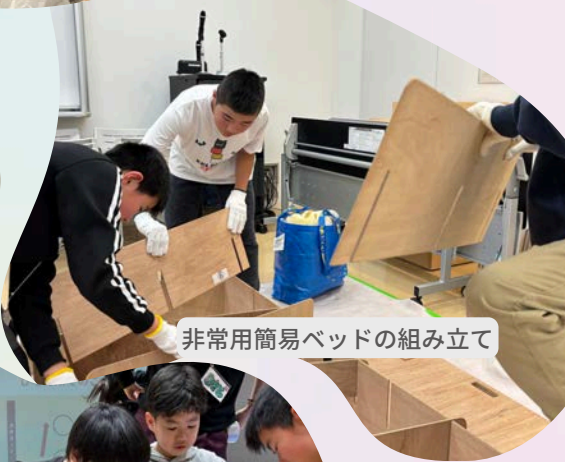
非常用簡易ベッドの組み立て