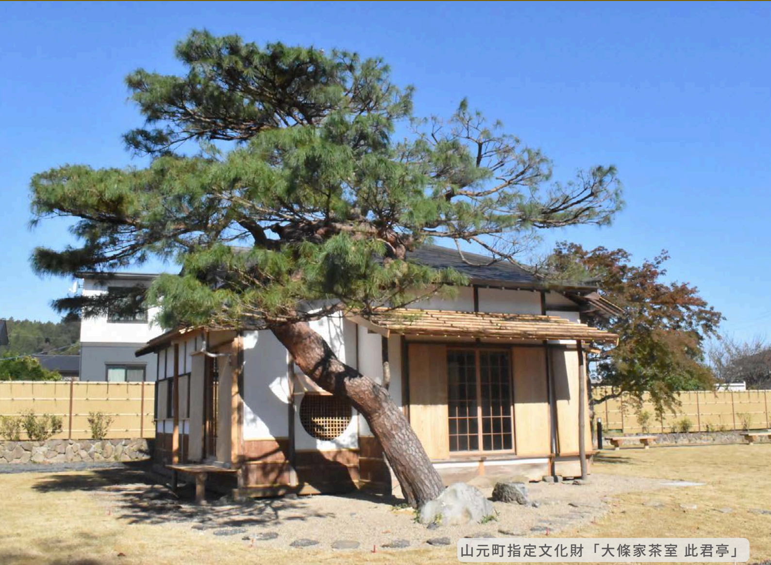
山元町指定文化財「大條家茶室 此君亭」