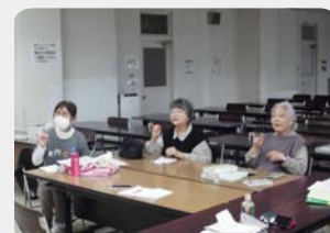
手話サークル (中央公民館)