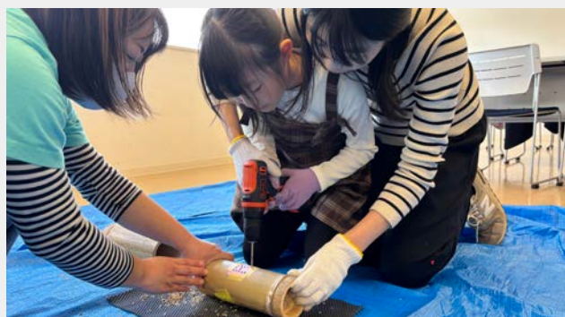
やまもと楽校 竹灯笼づくり