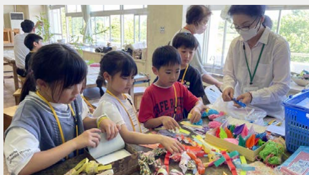
放課後子ども教室 はまっこキッズ 七夕飾り作り