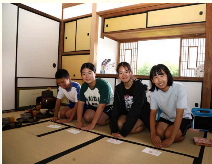
坂元小学校「茶道クラブ」