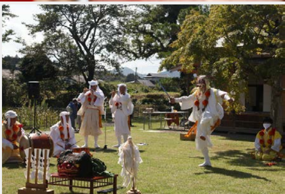
文化協会 文化推進事業「此君亭 秋の集い」 茶室前で披露された坂元神楽 法剣の舞