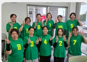
バレーボールチーム「Yamamoto」 (町民体育館)