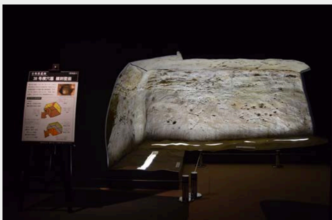
飛鳥時代の線刻壁画の実物展示は国内唯一!

平成30年11月に展示内容を大幅リニューアル。「合戦原遺跡(飛鳥時代)」の横穴墓で発見された「線刻壁画(実物)」や近年の発掘調査で発見された弥生時代の津波痕跡などを新たに展示物として加え、山元町の縄文時代から現代までの考古・歴史・民俗・自然に関する資料を公開しています。