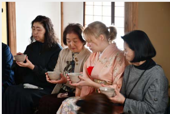
大條家茶室此君亭 やまもとふれあい茶会