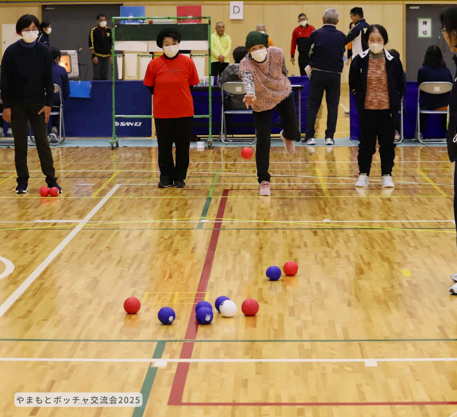
やまもとボッチャ交流会2025