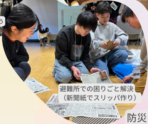
避難所での困りごと解決 (新聞紙でスリッパ作り)