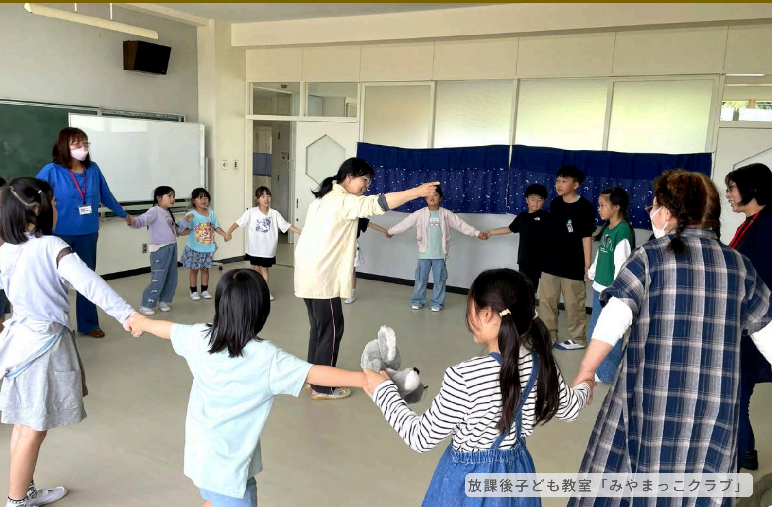
放課後子ども教室「みやまっこクラブ」