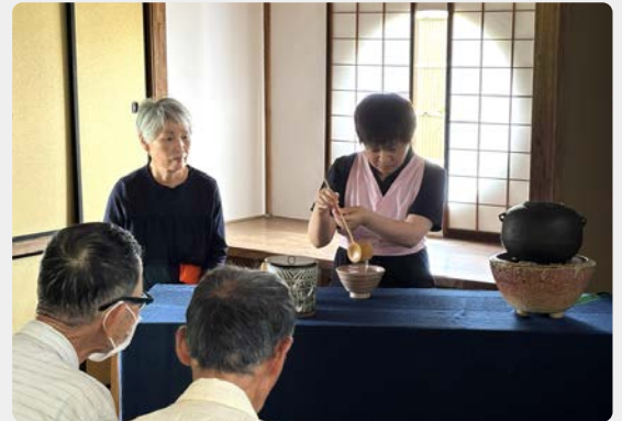
令和7年度 ユニバーサルな学びの場事業 「楽しく学ぼう『大條家茶室 此君亭』のこと」