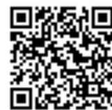
震災遺構中浜小学校 ホームページ▲