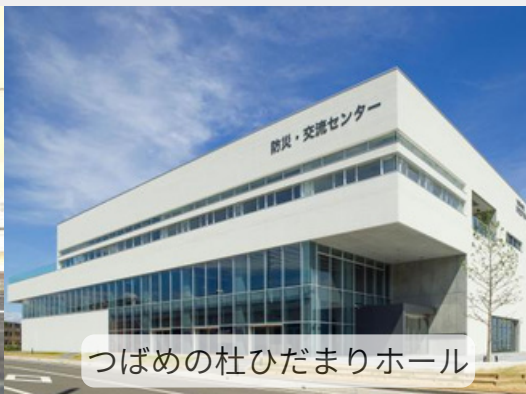
つばめの杜ひだまりホール