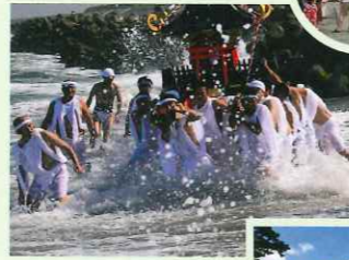
八重垣神社 夏祭り (お天王さん祭り) 日/7月最終の土・日曜日 所/八重垣神社