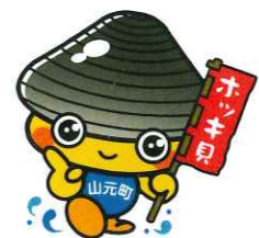
山元町PR担当係長 ホッキーくん