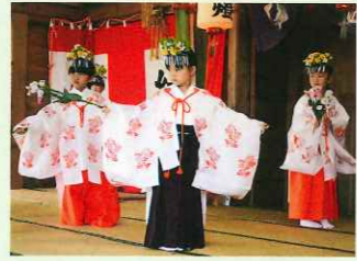
坂元神社 夏祭り 日/7月最終の土曜日 所/坂元神社