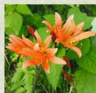
キツネノカミソリ