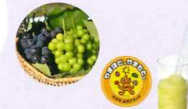
シャインマスカット スムージー