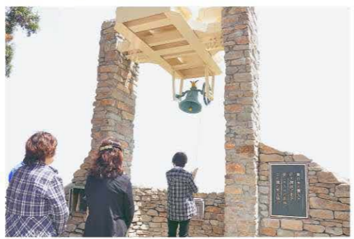
▲犠牲者の冥福を祈り、鎮魂の鐘を鳴らす参列者

理事長は「感動で胸がいっぱいです。鐘とともに、悲惨な記憶を末代まで引き継ぎ、温かく見守っていききたい」と涙ぐんでいました。