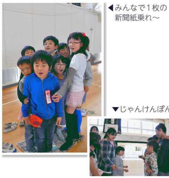
◀みんなで1枚の新聞紙乗れ～