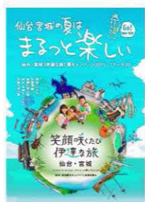
総合ガイドブック イメージ