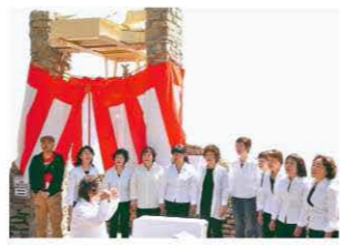
▶歌手のさとう宗幸さんとコーラスグループが「花は咲く」を歌いました