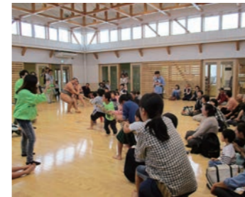
お相撲さんと綱引きでガチンコ対決

10月8日、二所ノ関部屋の力士によるふれあいイベントが開催されました。 このイベントは霊友会東北支局と共催により開催されたものです。