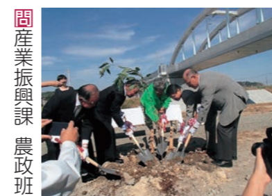
立派な桜並木に成長することを願い、植樹しました