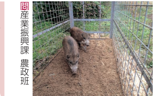
☎ 産業振興課 農政班