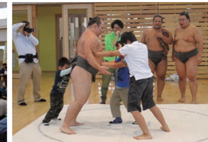
はっけよ〜い、のこった!

当日は、子どもたちや地域の皆さんなど約165人もの方々が、4人の力士による稽古の実演や子どもたちの相撲体験、綱引き対決などで大いに盛り上がりました。 お昼には、おいしいちやんこ鍋が振る舞われ、力士の皆さんとの交流を楽しみました。