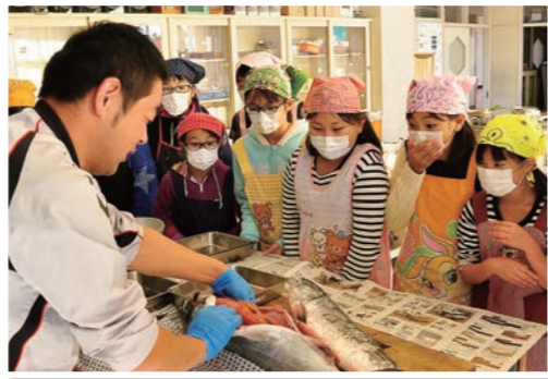
サケのお腹から大量のはらこめし

その後、児童たちは、3つのグループに分かれ、食生活改善推進員の指導を受けながら、はらこめし作りを体験。この日のメニューは、はらこめし、あら汁、パプリカのきんぴら、りんごの4種類で、児童たちはにぎやかに調理を楽しんでいました。