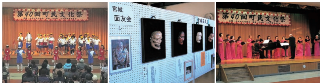
坂元小学校児童による鼓笛隊 力作揃いの展示コーナー すみれコーラスによる合唱

天候にも恵まれた今年の文化祭は、「絵画」や「写真」、「盆栽」などの作品展示、「民謡」や「舞踊」などのステージ発表が行われたほか、会場外に出店ブースを設け、町内の特産品などを販売し、賑わいのある文化祭となりました。