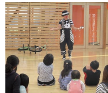
クラウンに夢中の子どもたち

広報9月号でお知らせしたファミリー川柳は、おかげさまで229句ものご応募をいただきました。 今後、応募いただいた川柳でかるたを作成します。皆さんの投票により、各文字一句の川柳を選定しますので、ご協力をお願いします。 投票期間 11月19日~ 12月24日(土) 投票場所 こどもセンター