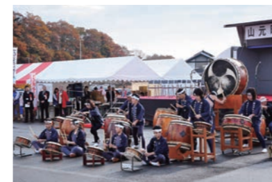
風雲乱打舞による迫力ある オープニング演奏