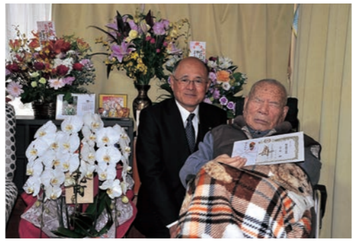
100歳おめでとうの祝い金