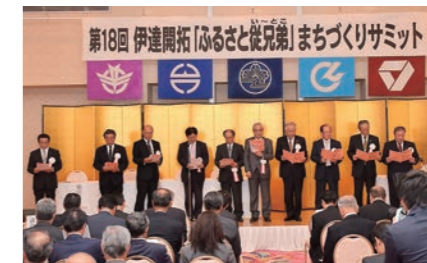
関係5市町によるサミット宣言