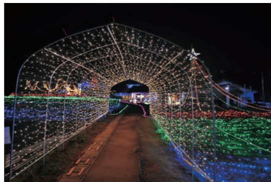
約25万球の光で彩られる今年の会場