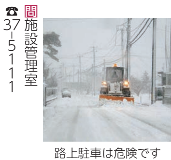
路上駐車は危険です

よりどころサロンを開催します よりどころサロンとは、認知症の方とその家族、地域の誰もが気軽に集い、交流できる場です。認知症について理解を深めることや情報交換の場として、語り合いませんか。創作活動なども企画しています。 日時 12月26日(月) 10時～12時 場所 やました幸街堂 (山寺字山下38番地) 内容 談話やレクリエーション、認知症に関するミニ講話、個別相談 参加料 無料 ※事前申込みは不要。 問 地域包括支援センター 37-3901 道路の除雪作業にご協力をお願いします 町では、大雪災害時に輸送路確保のため、町道を中心に除雪作業を行います。