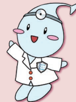
公益社団法人日本水道協会PRキャラクター Dr. すいどー

1人あたり1日3ℓ×3日=9ℓが目安です。 成人で体重が60キログラムの人が必要とする1日当たりの水分量は3ℓと言われ、食事や飲用することで摂取します。非常用に保管する場合は、最低3日分の準備が望ましいです。賞味期限の長い市販のミネラルウォーターや災害用長期保存水を活用すると手間がかかりません。また、賞味期限が切れたものは風呂・トイレ等の生活用水として利用できます。