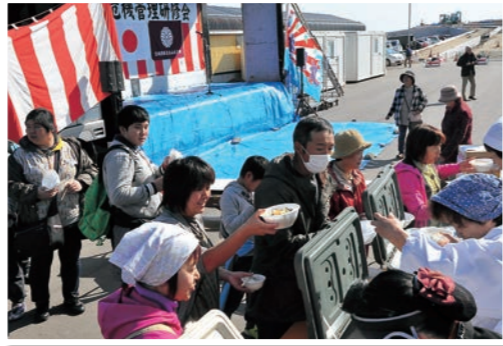
お昼に炊き出しの鮭汁とご飯が提供されました

お昼は、炊事車で作られた温かい鮭汁とご飯が提供され、参加者はおいしそうにほおぼっていました。昼食後は、山元フラダンスと日赤奉仕団巨理分区関係者による歌や踊りなどのアトラクションが披露されるなど、防災意識を高めつつも楽しめる研修会となりました。