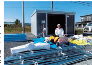
有効活用させていただきます

コミュニティ助成事業で防災備品を整備 花釜区では、一般財団法人自治総合センターの「平成28年度コミュニティ助成」を受け、災害発生時の自主的な防災活動を実施するために必要となる防災備品庫、集会用テント、小型強力防水トランシーバー、ハロゲンライトセット、エンジンチェーンソー等の整備を行いました。