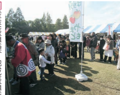
りんごを買い求める長蛇の列

10月16日、海岸防災林の復旧する植樹活動が山寺字須賀地内で開催されました。この活動は、県と町、植樹活動を希望する団体の3