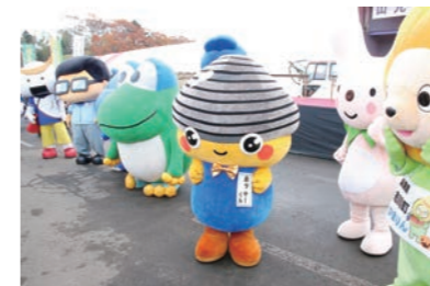
ステージ前で勢ぞろいした ホッキーくんと各地のゆるキャラたち