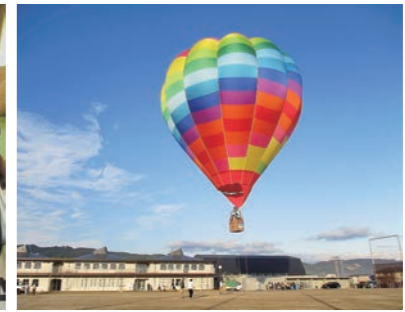
空からの眺めは最高でした