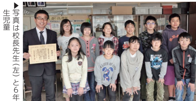
写真は校長先生(左)と6年生児童