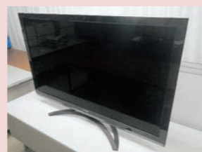
本町で差し押えを行った動産 47型液晶カラーテレビ