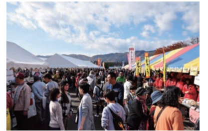
たくさんの方が会場に訪れました

特に、職員の派遣など、町の復興に助力いただいた全国の自治体が出店する「復興支援ブース」は、全国各地の特産品を味わえるとあって、例年以上の人気でブース前には長蛇の列ができるほどの賑わいでした。