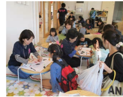
親子でハロウィン工作

当日、館内では地域の皆さんや全国の児童館スタッフの皆さんなどによる遊びや体験、工作などのブースが設けられたほか、外では楸フジタの協力による「高所作業車での空中散歩」が行われました。約450人もの方々が会場を訪れ、さまざまなブースを楽しみ、館内は大賑わいでした。 早朝には、熱気球クラブ「永飛男」の協力により山下第二小学校校庭で熱気球搭乗体験が行われ、約50人の方々が上空から新市街地を眺めるという貴重な体験をすることができました。