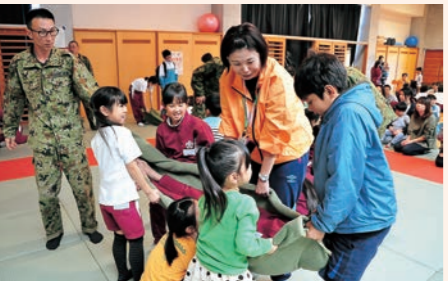
10月28日 「総合防災訓練」を実施。昨年を上回る2914人が参加。