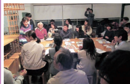
▲多くの方に参加していただきました

日は参加者が30人を超える交流会になりました。参加者からの「山元町をまた訪れたい」「関わりを続けたい」という声が多くあったことから、今後、具体的な受け皿づくりを進めていきます。