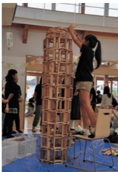
▶高い塔にも挑戦してみよう

スギの木でできた積み木玩具「スギックモック」を使って、いろいろな形を作ってみよう。遊び方は自由です。 日時 1月26日(土) ① 10時～10時50分 ② 11時～11時50分 対象者