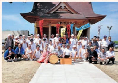
7月下旬 町内各地で夏祭りが開催。(写真は八重垣神社神輿渡御)