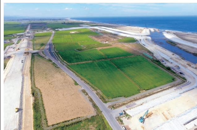
☎ 東部地区基盤整備推進室 ☎ 29-8007

今後は主に、農地の排水を改良する暗渠排水工事と完成した農地の不具合などを改善する補完工事を進め、さらなる営農環境の整備を図っていきます。