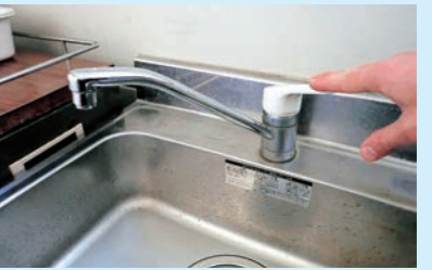
③水が出なくなったことを確認して、蛇口を閉めます。

※水抜き解除は、全ての蛇口が閉まっていることを確認し、水抜き栓が完全に止まるまで反時計回りに回します。