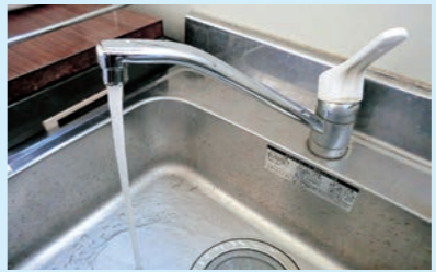
②宅内全ての蛇口を開けて水を出します。