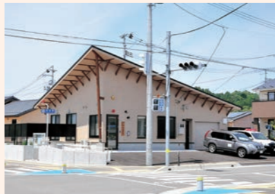
4月26日 東日本大震災で流失した坂元駐在所の開所式が坂元新市街地で執り行われる。