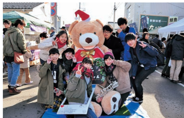
▶クマのぬいぐるみと一緒に記念撮影