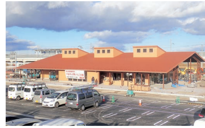
☎ 産業振興課 交流拠点整備推進班 ☎ 37-1119

交流人口の増加をはじめ、町の地域振興の拠点として大きな期待が寄せられる当施設は、2月6日(水)、7日(木)に、町民や出資者を対象としたプレオープン、2月9日(土)には、グランドオープンとしてセレモニーやイベントなどを開催します。