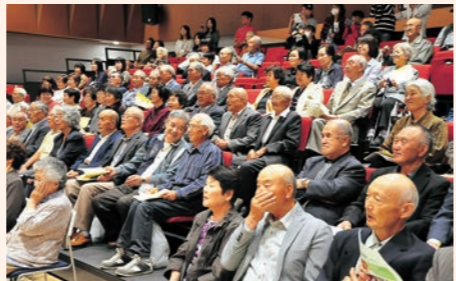
9月15日 「平成30年度山元町敬老会」を開催。155人が出席。