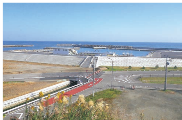
☎ まちづくり整備課 ☎ 29-8004

避難路10本のうち5本については整備が完了し、残る5本(県道含む)についても用地買収や工事に着手しており、整備の完了は平成33年3月を予定しています。