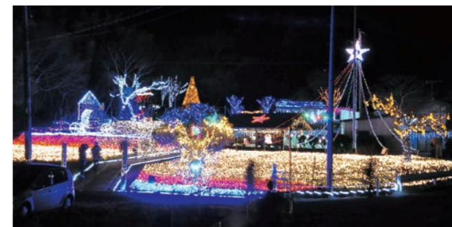
▲光に包まれた小平農村公園