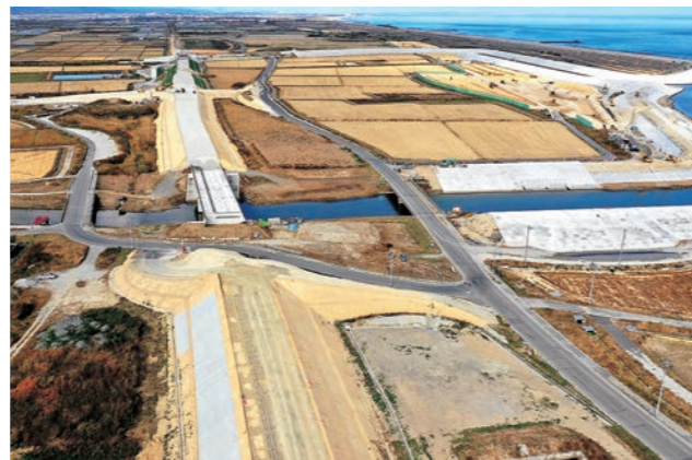
☎ まちづくり整備課 ☎ 29-8004 ☎ 震災復興企画課 ☎ 37-0497

平成30年12月末現在で、福島県境から高瀬字新浜までの約6,000㌥区間の盛土工事および橋梁工事を施工しています。平成31年は残区間の道路改良工事の発注と併せて舗装工事にも着手していく予定であり、全線整備完了に向け、鋭意工事を進めています。