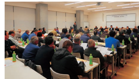
▲出荷者組織設立総会

また「直売所」への出荷希望者は、原則として「友の会」に入会していただく必要があります。引き続き、入会申し込みを受け付けていますので、詳細は「友の会」事務局(株式会社やまもと地域振興公社)までお問い合わせください。