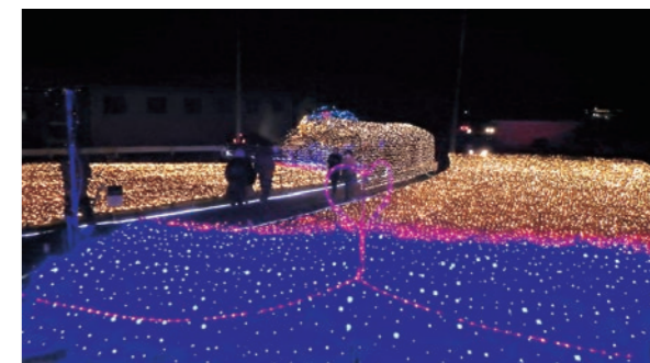
▲色とりどりのイルミネーションが園内を彩る