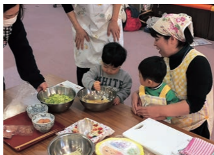
▲お子さんも一緒に料理を作れます

日時 1月24日(木) 10時30分～11時45分 (受け付け10時15分) 場所 防災拠点・山下地域交流センター「つばめの杜ひだまりホール」 3階調理室・和室 対象者 未就園児と保護者 ※見守り託児あります。 持ち物 エプロン、三角巾、飲み物 参加費 無料