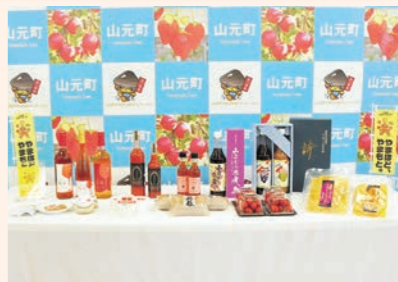
5月24日 山元ブランド「やまほど、やまもと。」の第2回認証書交付式を挙行し、新たに12品目を認証。