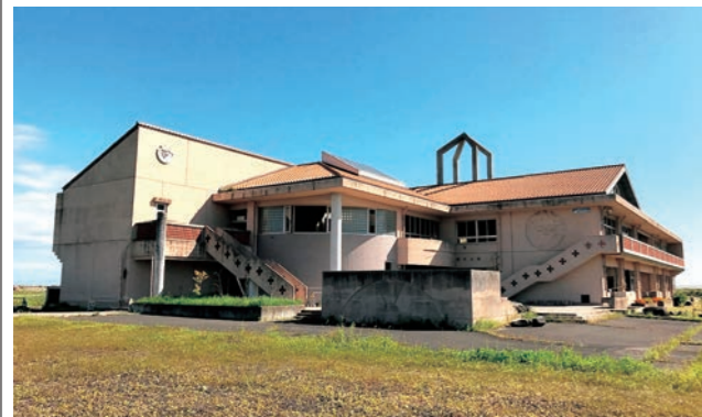
☎ 生涯学習課 ☎ 37-5116

昨年11月には被災した状態のまま内部公開を行うために必要な建築基準法の適用除外手続きが完了し、来年度は改修工事に着手する予定です。