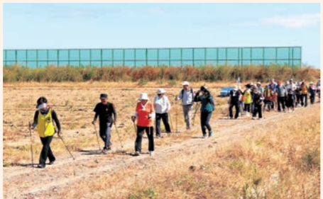
10月8日 「元気やまもと秋を満喫ウォーク」を開催。178人が参加。