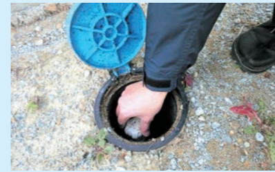
①水抜き栓が完全に止まるまで時計回りに回します。