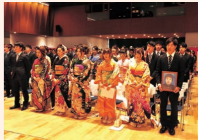
1月7日 20歳の節目「成人式」を挙行。新成人99人が出席。

2018年ほどのような年でしたか？このコーナーでは、昨年、町内であった主な出来事を振り返ります。 町では、2019年も「キラリやまもとーみんなの希望と笑顔が輝くまち」の総仕上げに向け「チーム山元 心をひとつに」進んでいきます。