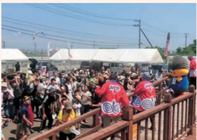
6月3日 第9回夢いちごの郷「ふれあい市」が開催。