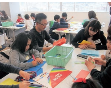
▲絵本づくりを体験する参加者

今年度2回目のロビーミニコンサートです。出演を希望される方を募集しています。 なお、観覧は無料です。皆さんのお越しをお待ちしています。 日時 1月19日(土) 13時～15時 会場 防災拠点・山下地域交流センター「つばめの杜ひだまりホール」 文化研修ホール