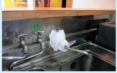
②蛇口根元にタオルや雑巾などを巻き付けます。