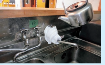
③巻き付けた部分にぬるま湯をかけてください。*