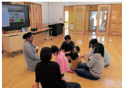
▲昨年11月はパズルも楽しみました