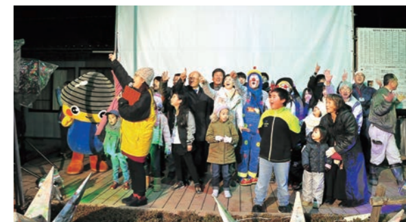
▲点灯前のカウントダウン

期間 平成30年12月9日(日)～1月12日(土) 時間 17:00～21:00 場所 小平農村公園