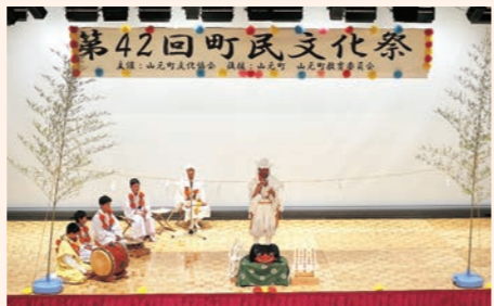
11月2日 「第42回町民文化祭」が開催。