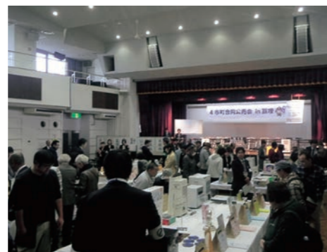
▲たくさんの方が会場を訪れました

なお、町からは差し押さえた液晶テレビなどを出品し、全ての品が落札されました。今後も、税負担の公平・公正性を図るため、差し押さえや搜索などを実施し、滞納整理に努めます。