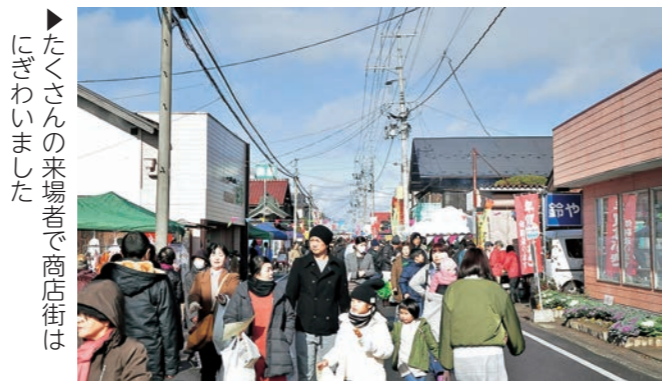
▶たくさんの来場者で商店街はにぎわいました

っていただき、うれしく思います」「いろんな方からこのイベントを知って欲しいです」などの声が聞かれました。