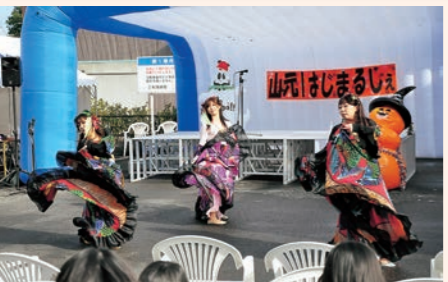
12月9日 第4回山元はじまるしえ」が開催。山下区商店街通りに約5,000人の来場者でにぎわつ。