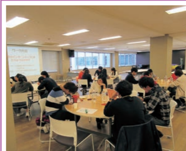
▲説明会に参加する学生たち

している方など、本事業に興味を持ったさまざまな学生が訪れています。現在は、5人の方から参加に関する問い合わせをいただいています。