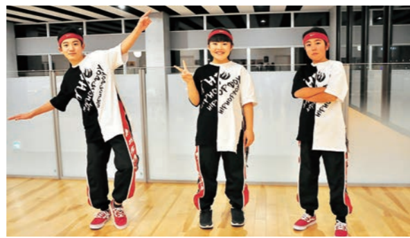
▶それぞれポーズを取ってもらいました